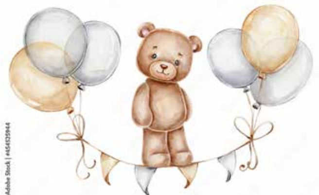
Motiv Geburten 11