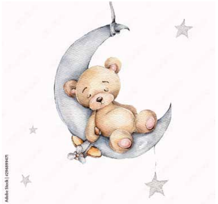
Motiv Geburten 10