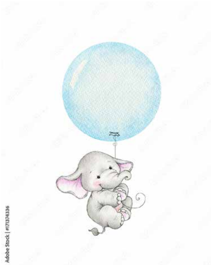
Motiv Geburten 09