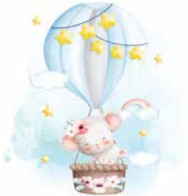
Motiv Geburten 07