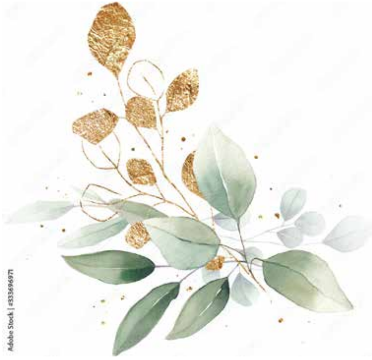
Motiv Jubiläum 23