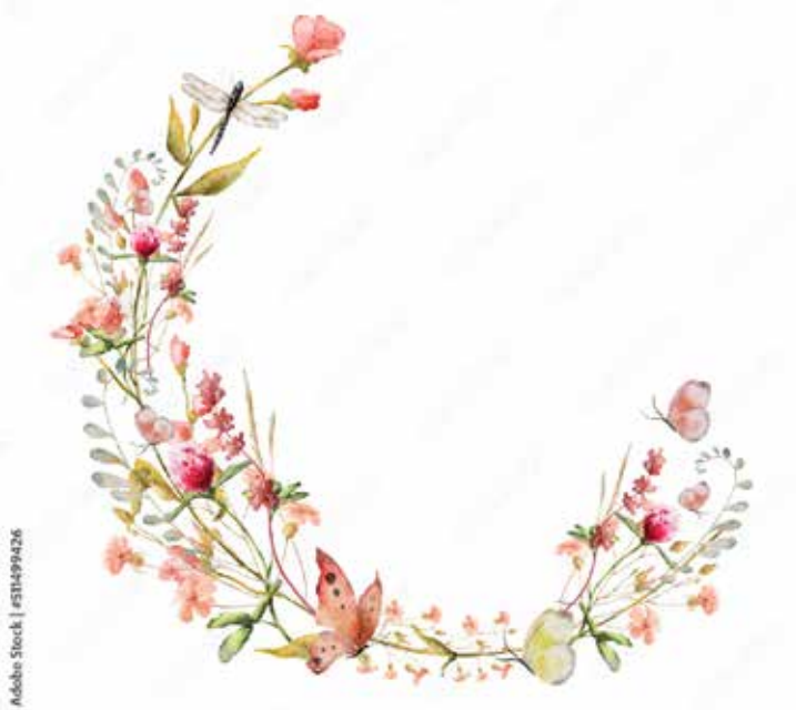
Motiv Geburtstag 18