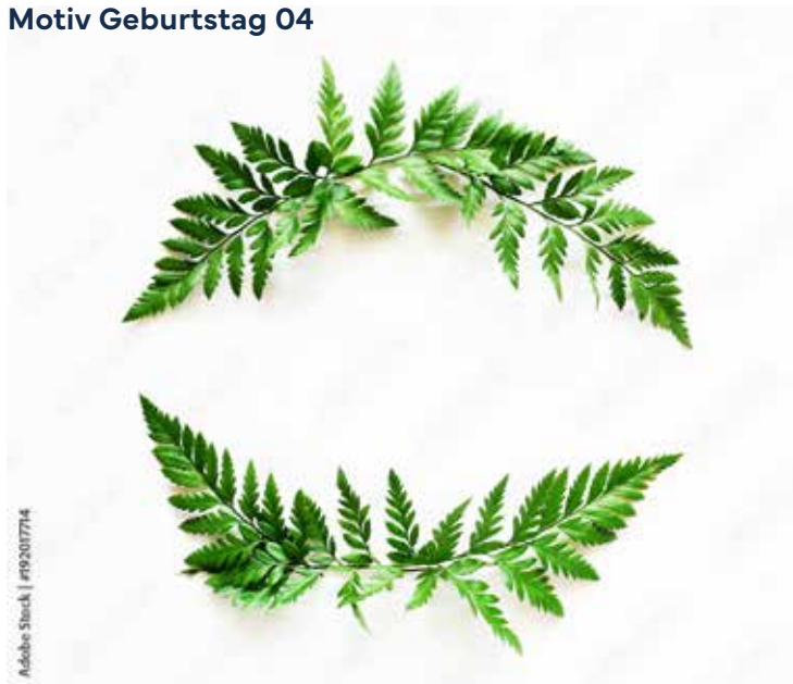
Motiv Geburtstag 04