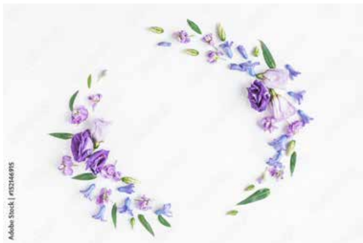
Motiv Geburtstag 06