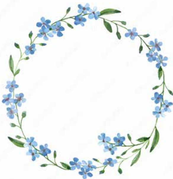
Motiv Geburtstag 14