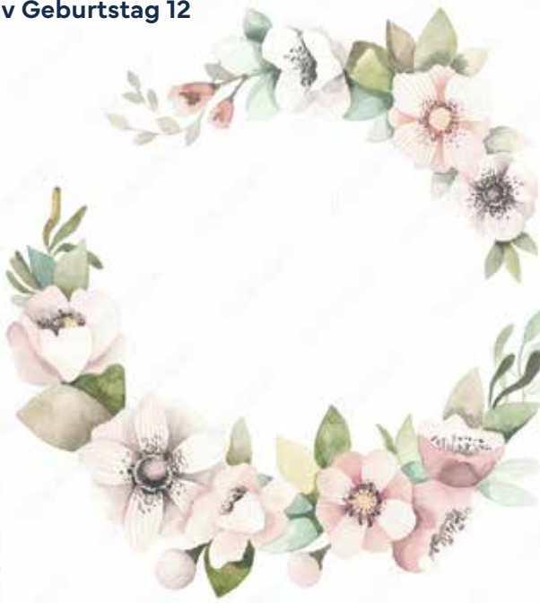
Motiv Geburtstag 12