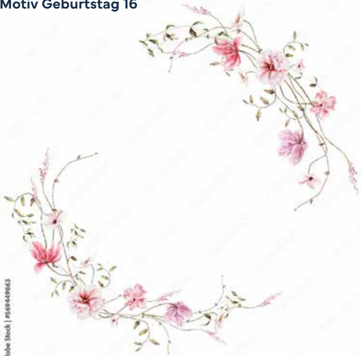
Motiv Geburtstag 16