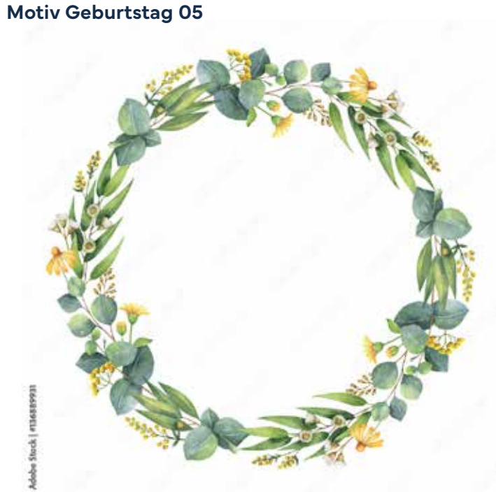
Motiv Geburtstag 05