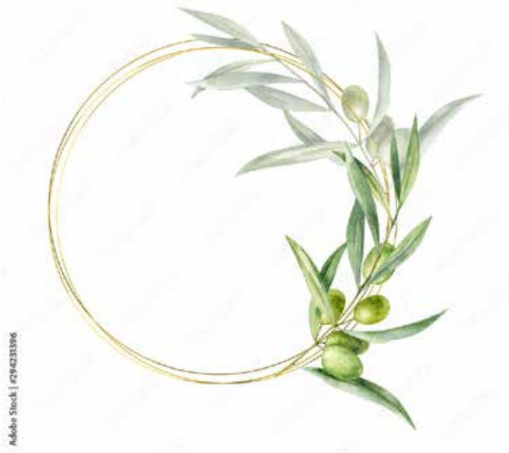
Motiv Geburtstag 21