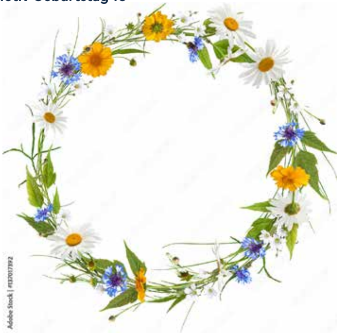
Motiv Geburtstag 10