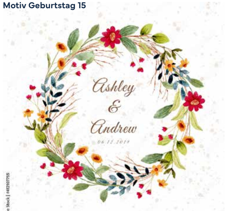
Motiv Geburtstag 15