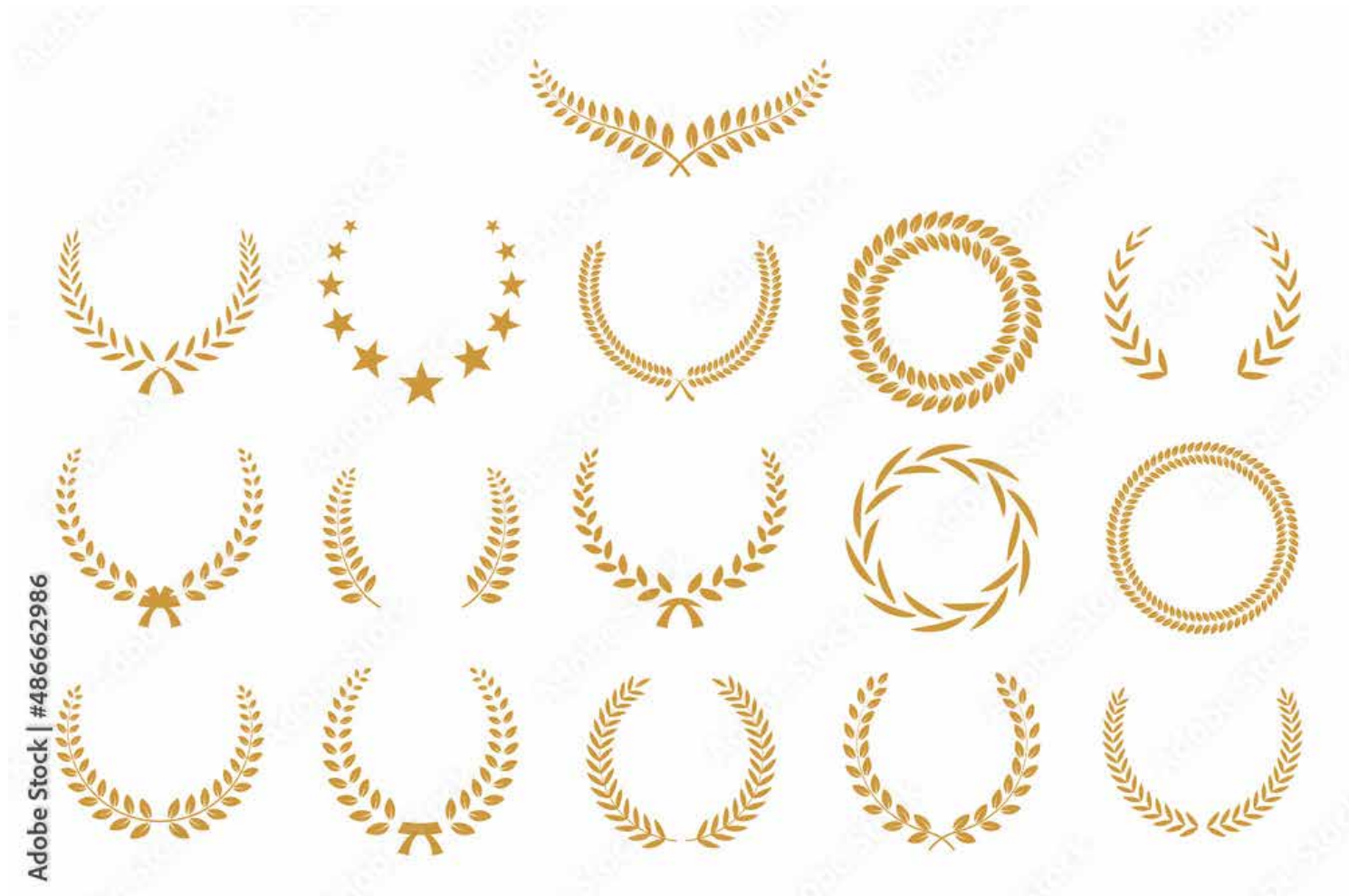
Motiv Geburtstag 35