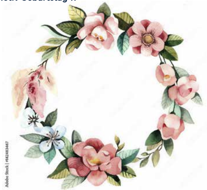
Motiv Geburtstag 11