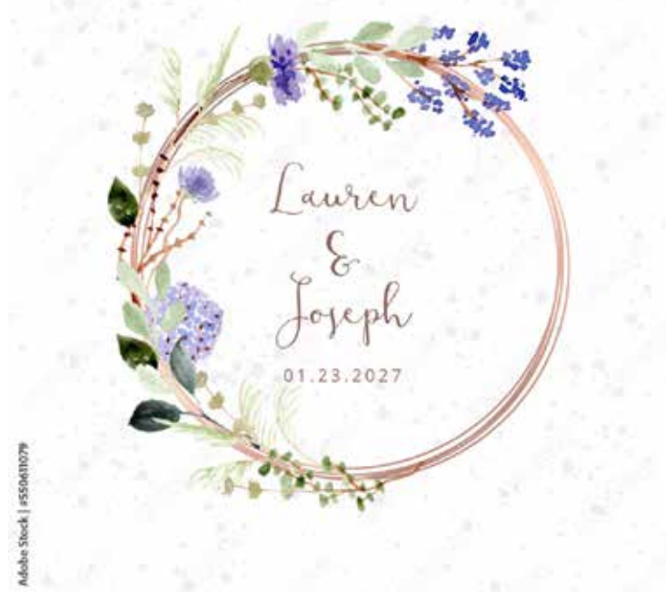
Motiv Geburtstag 26