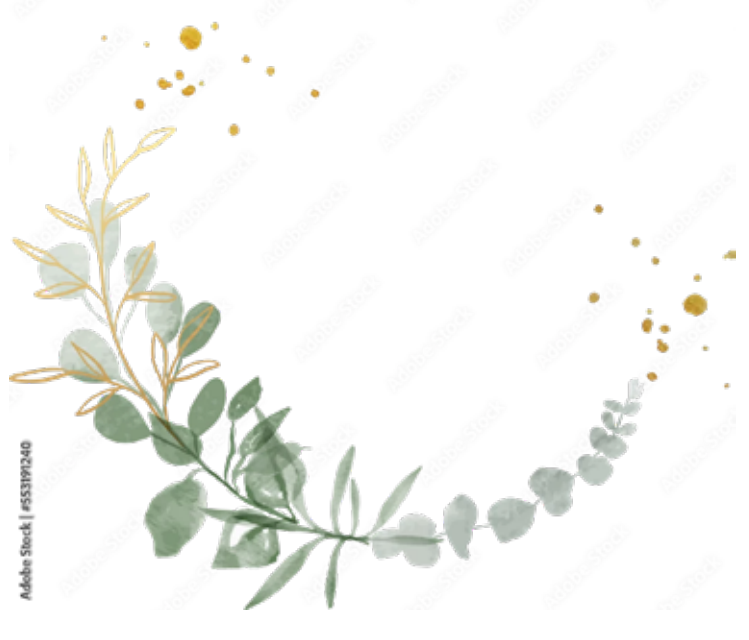
Motiv Geburtstag 19