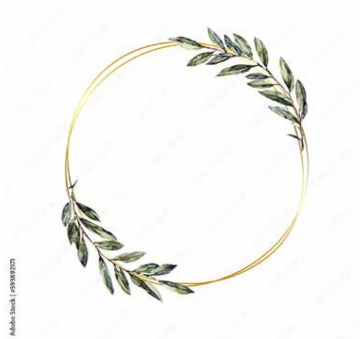
Motiv Geburtstag 22