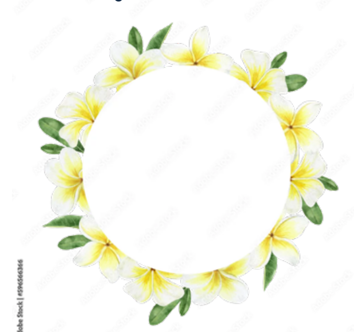
Motiv Geburtstag 09