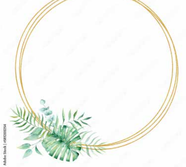
Motiv Geburtstag 25