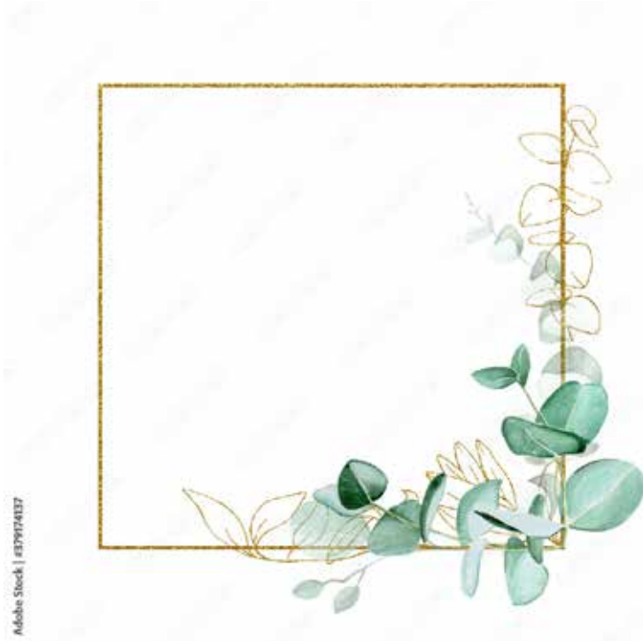
Motiv Geburtstag 37