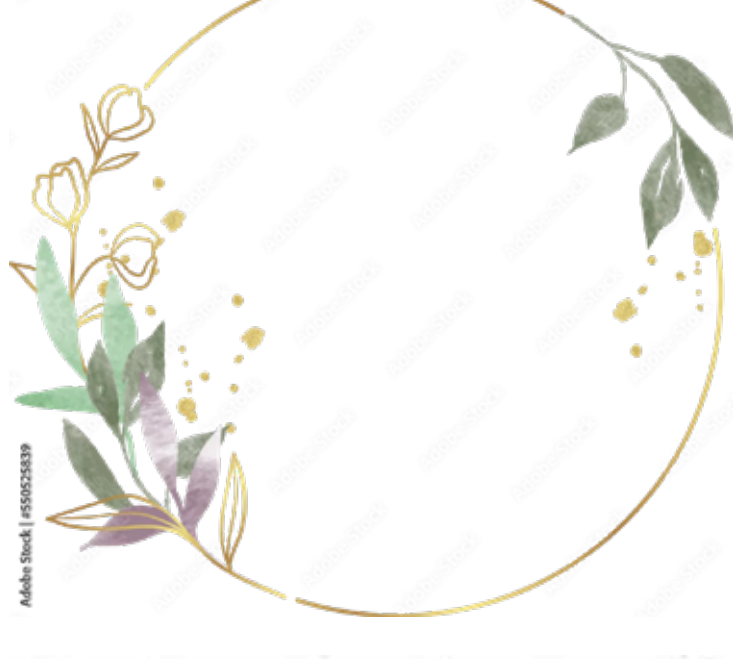
Motiv Geburtstag 24