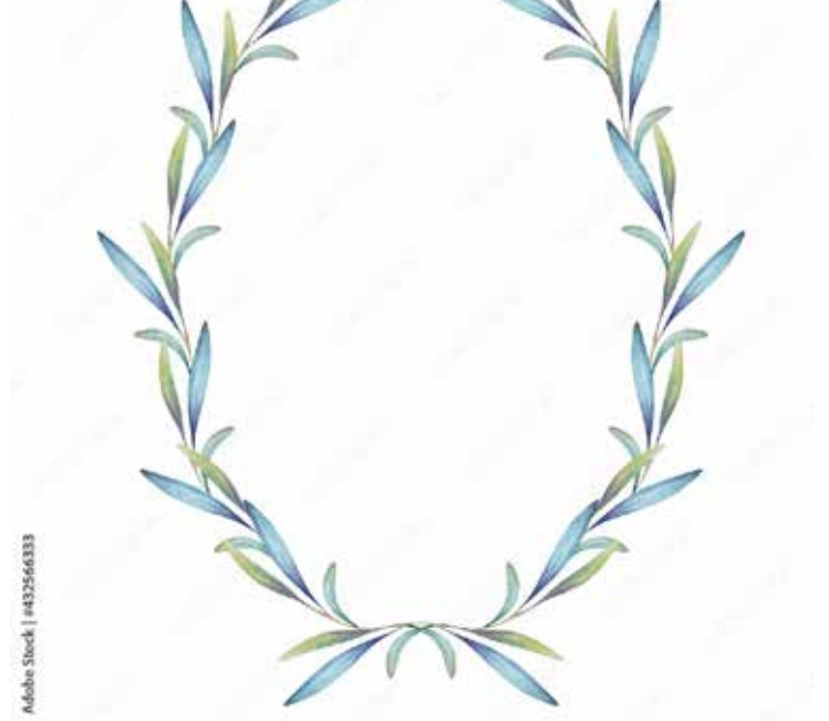
Motiv Geburtstag 20