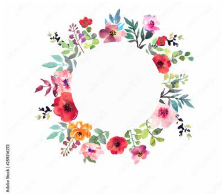
Motiv Geburtstag 13