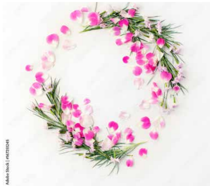
Motiv Geburtstag 07