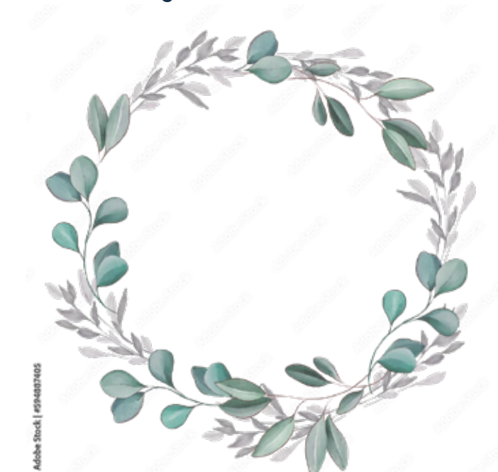
Motiv Geburtstag 08