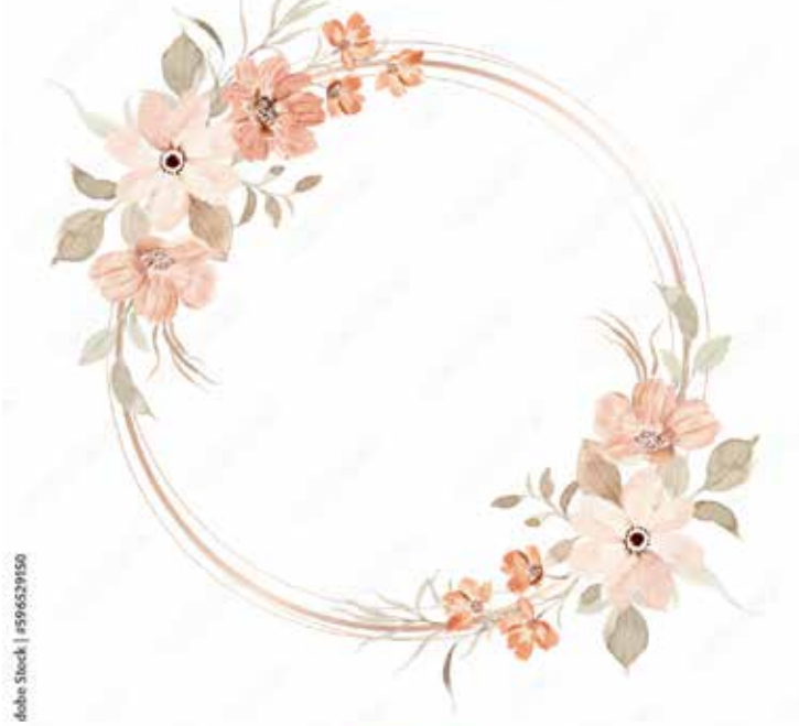
Motiv Geburtstag 23