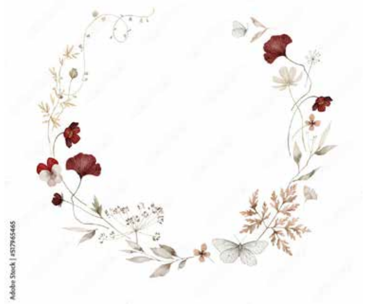
Motiv Geburtstag 17