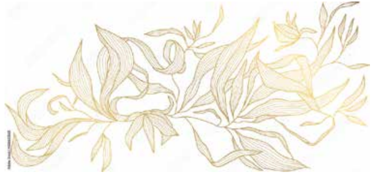
Motiv Jubiläum 25