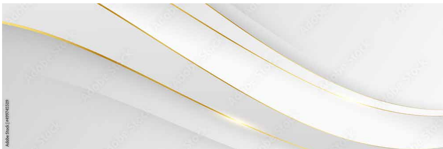
Motiv Jubiläum 08