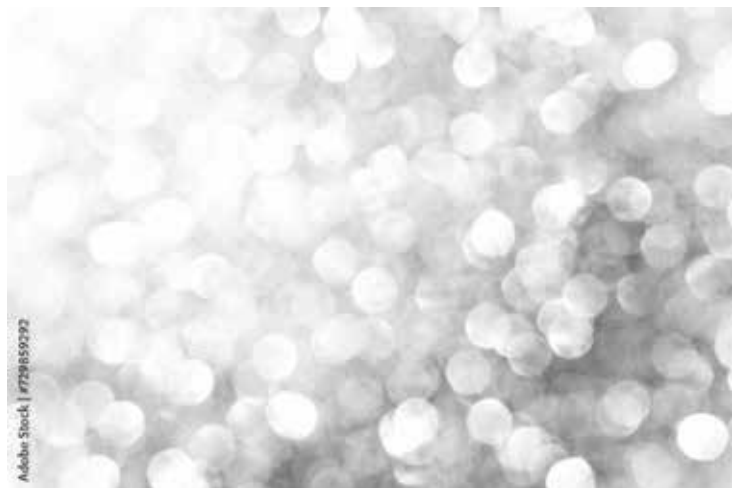
Motiv Jubiläum 04