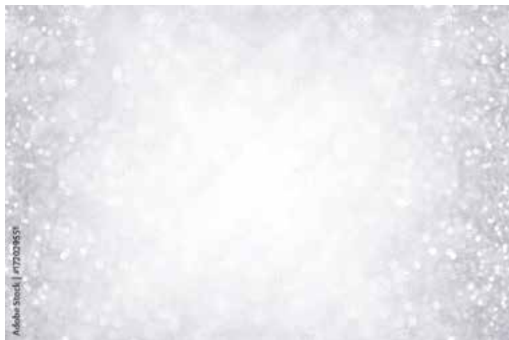
Motiv Jubiläum 05