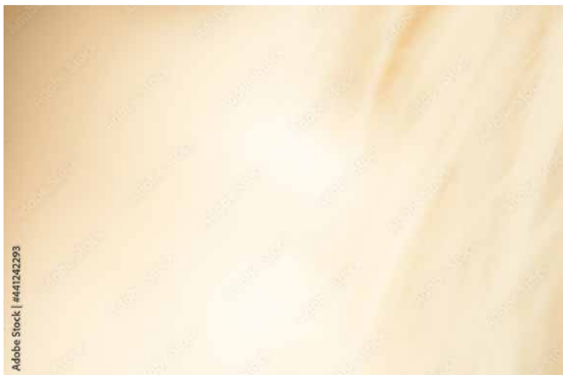
Motiv Jubiläum 12