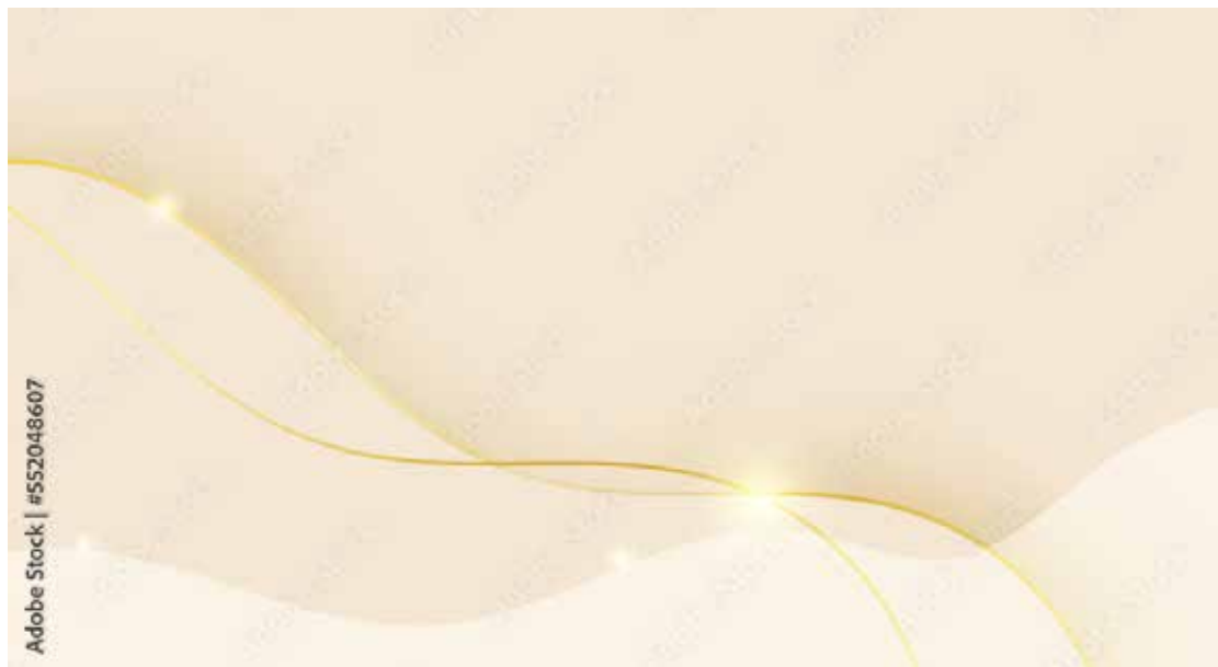
Motiv Jubiläum 10