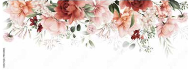
Motiv Jubiläum 17