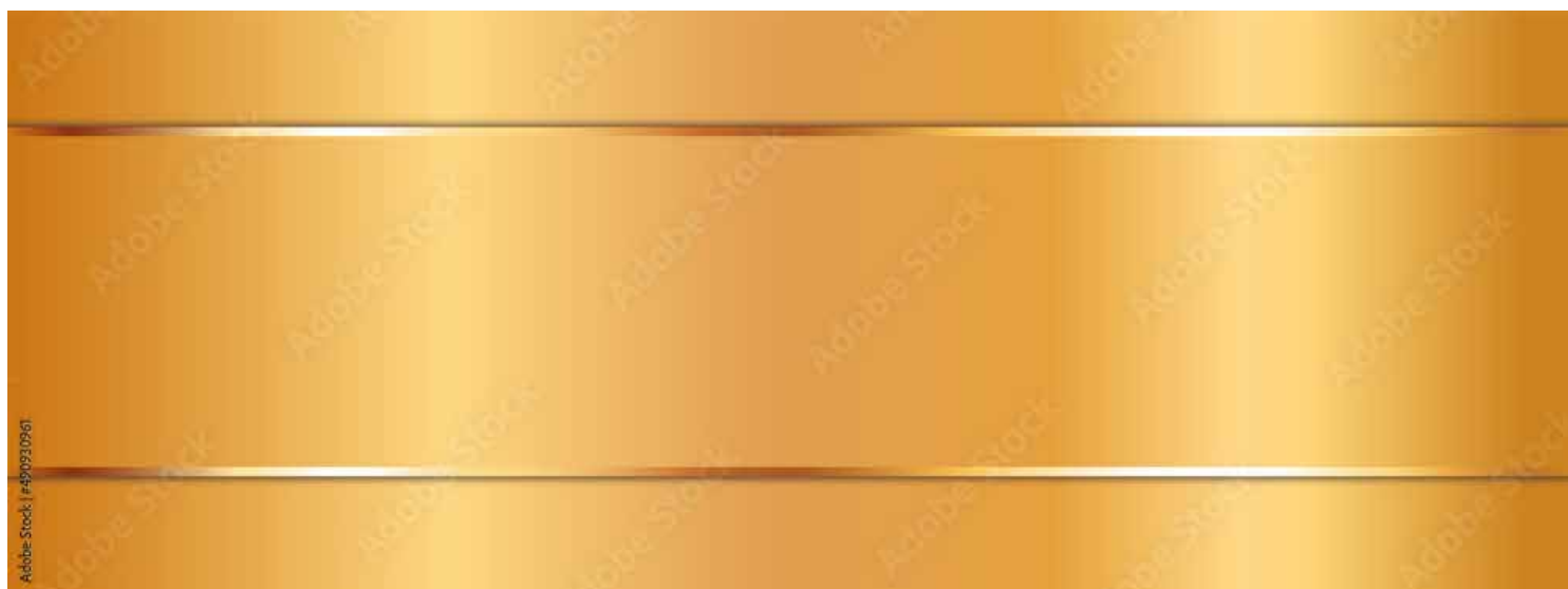
Motiv Jubiläum 09