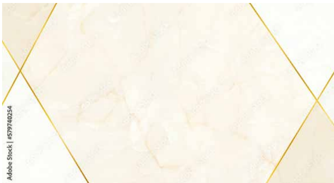
Motiv Jubiläum 11