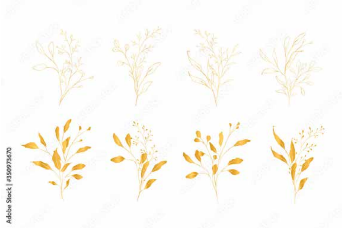
Motiv Jubiläum 26